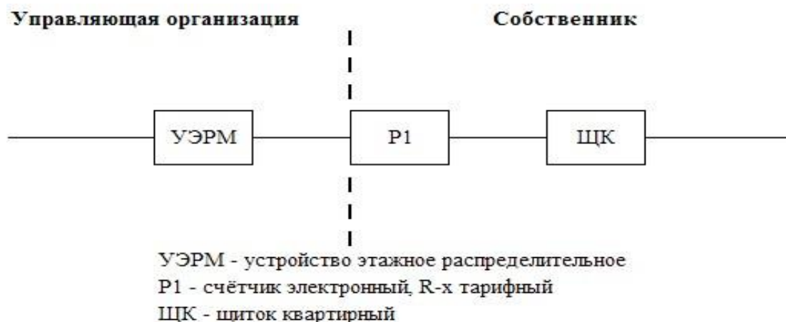
Схема № 2

Управляющая организация несет ответственность за надлежащее состояние и работоспособность питающих электрических сетей на помещение согласно нижеуказанной схеме до прибора учета (пунктирной линии слева).