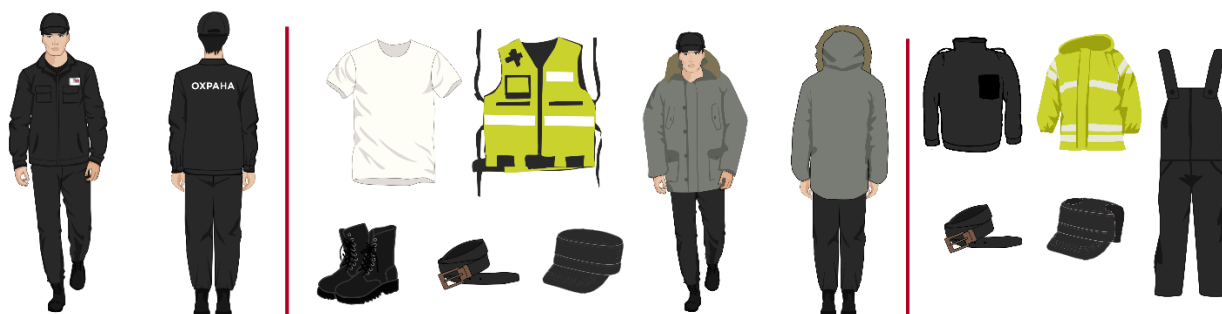
Костюм охранника патруль/ парковка