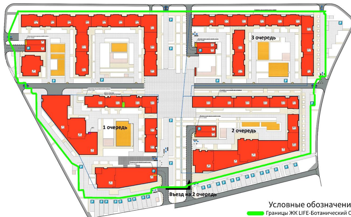
Схема земельного участка

Управляющая компания предлагает собственникам включить данную услугу в договор управления для того, чтобы обеспечить ее надлежащее состояние и содержание.