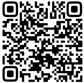
QR-Код на «Бланк решения»