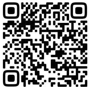
QR-Код на «Сообщение о проведении внеочередного общего собрания собственников»