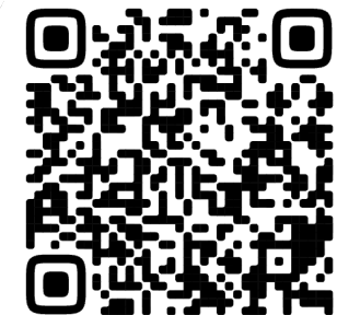
QR-Код на «Договор управления многоквартирным домом»

Уровень инфляции (индекс потребительских цен в Российской Федерации на товары и услуги) принимается за среднее значение полного истекшего года к полному предыдущему календарному году.