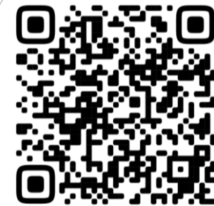
QR-Код на «Положение об организации видеонаблюдения»

✓ Утвердить ежемесячный размер платы в размере 24 руб. 14 коп. с 1 кв. м. жилого/нежилого помещения и машино-места, с включением дополнительной услуги в единый платежный документ с даты начала ее оказания.